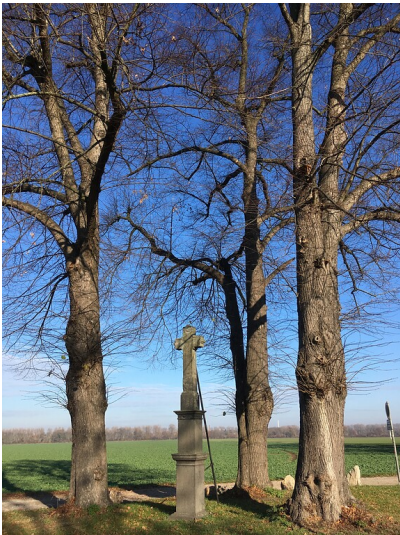
Wegekreuz drei Linden bei Haus Bürgel (2018)