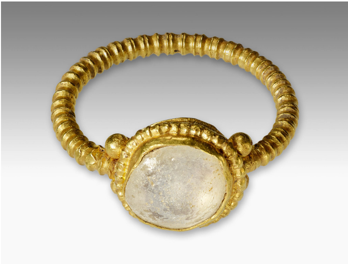
Grabbeigabe aus dem Gräberfeld an der Kölnstraße in Bonn (2014)