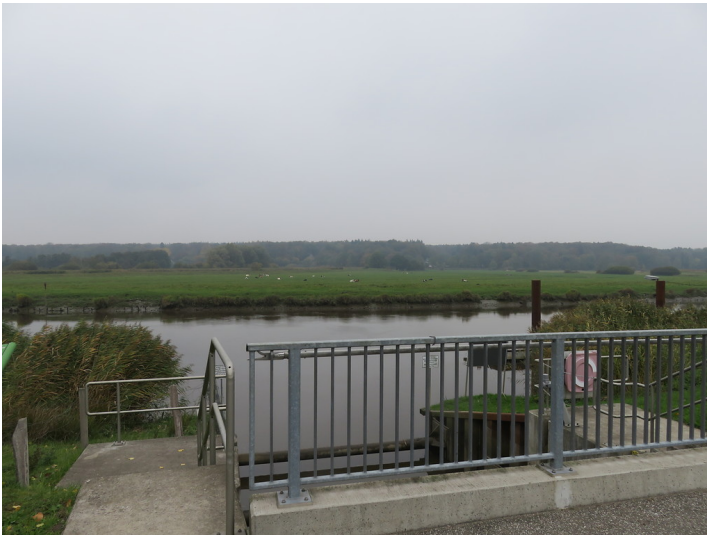
Breitenburger Kanal und Schleuse (2018)