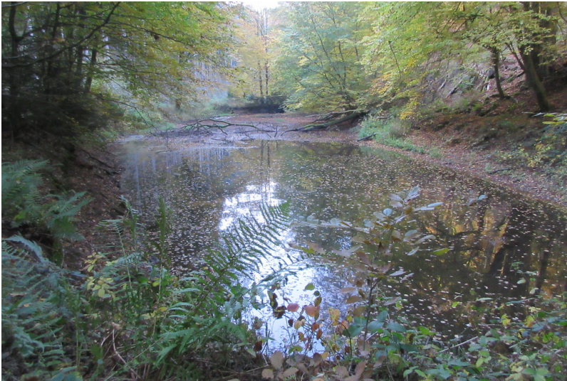
Storrwoog am Storbach (2018)