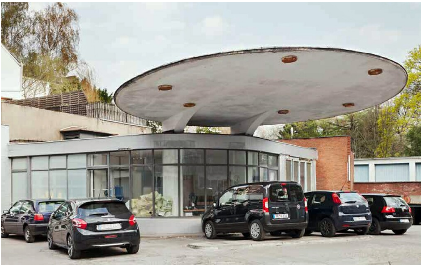
Die Tankstelle im Garagenhof Cockerill in Burtscheid (2014).