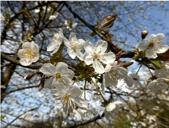
Kirschbaumblüten (2021)