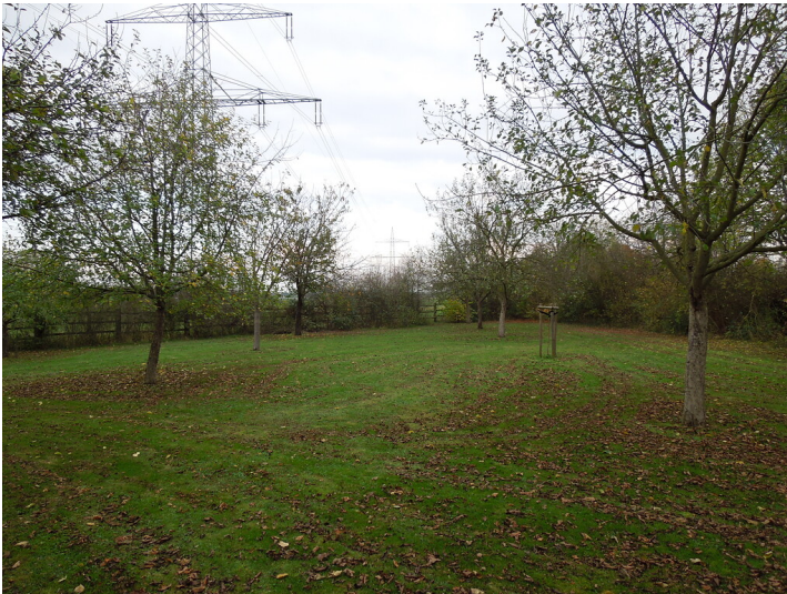
Blick auf die Streuobstwiese im Stadtteil Pulheim (2017)