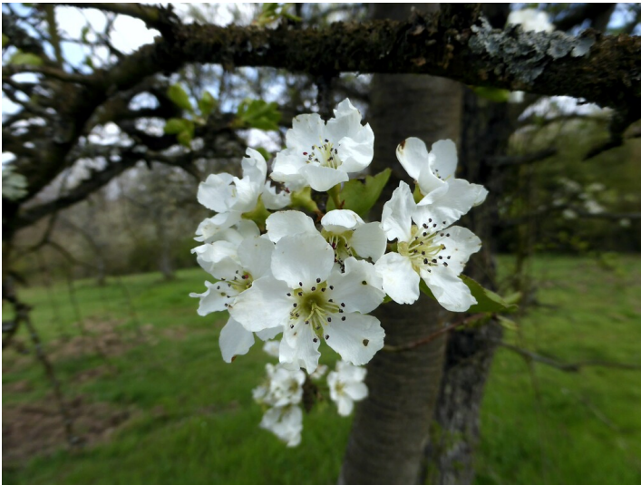
Birnbaumblüten (2021)