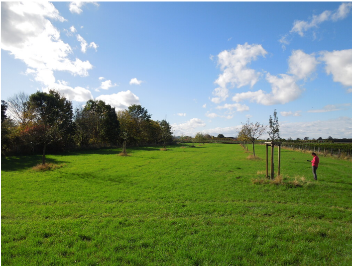
Blick auf die Streuobstwiese im Stadtteil Lechenich (2017)