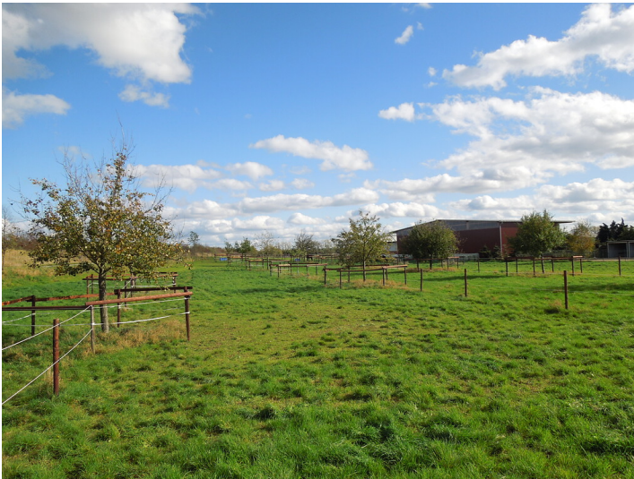
Blick auf die Streuobstwiese im Stadtteil Lechenich (2017)