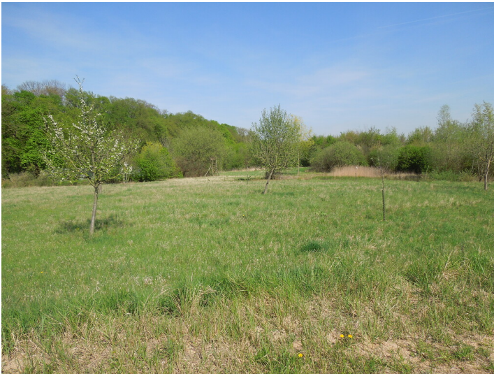
Blick auf die Streuobstwiese im Stadtteil Heppendorf (2017)