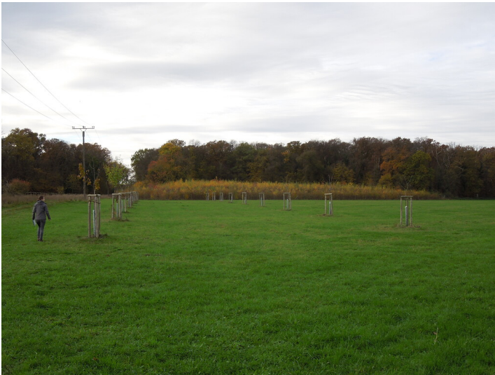
Blick auf die Streuobstwiese im Stadtteil Friesheim (2017)