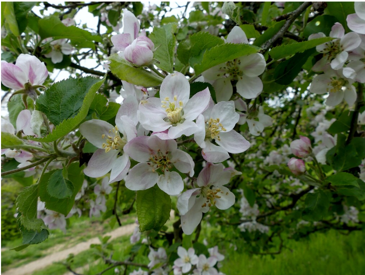
Apfelbaumblüten (2021)