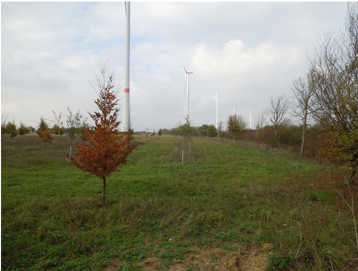
Blick auf die Streuobstwiese im Stadtteil Kaster (2017)