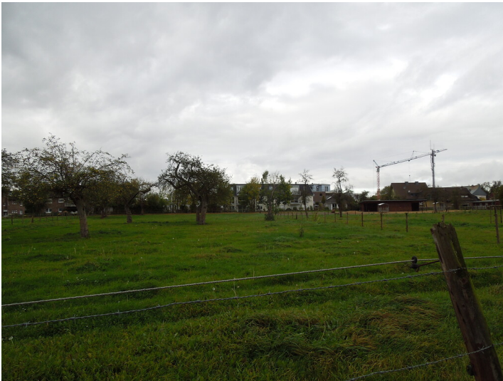
Blick auf die Streuobstwiese im Stadtteil Lechenich (2017)