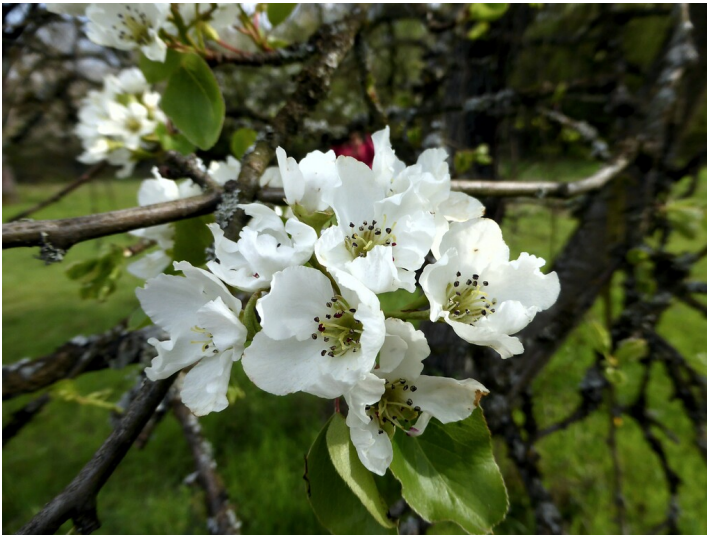
Birnbaumblüten (2021)