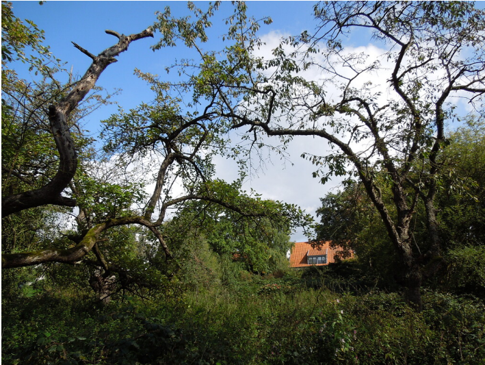
Blick auf die Streuobstwiese in Bonn-Ippendorf (2017)