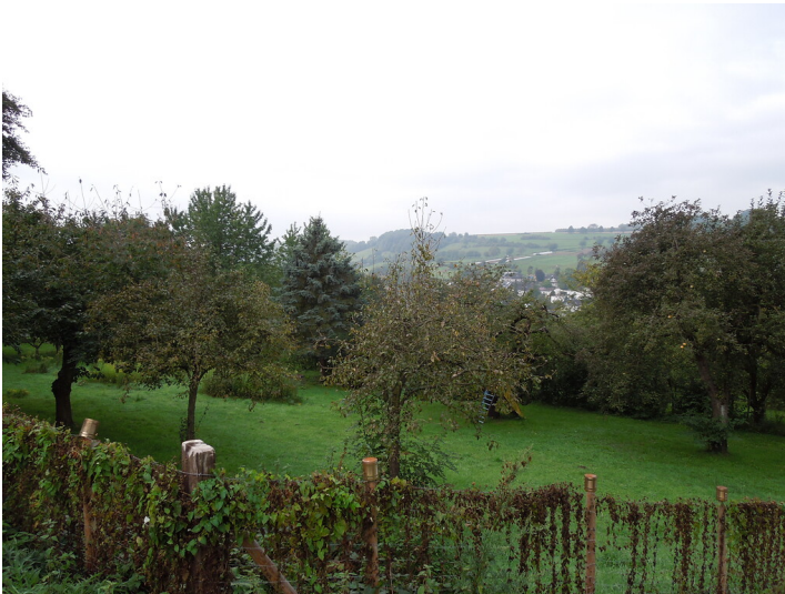
Blick auf die Streuobstwiese in Bonn- Mehlem (2017)