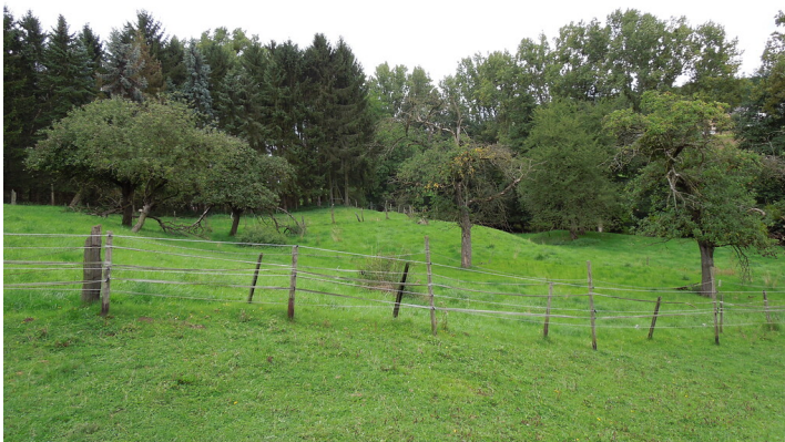
Blick auf die Streuobstwiese in Bonn-Lengsdorf (2017)