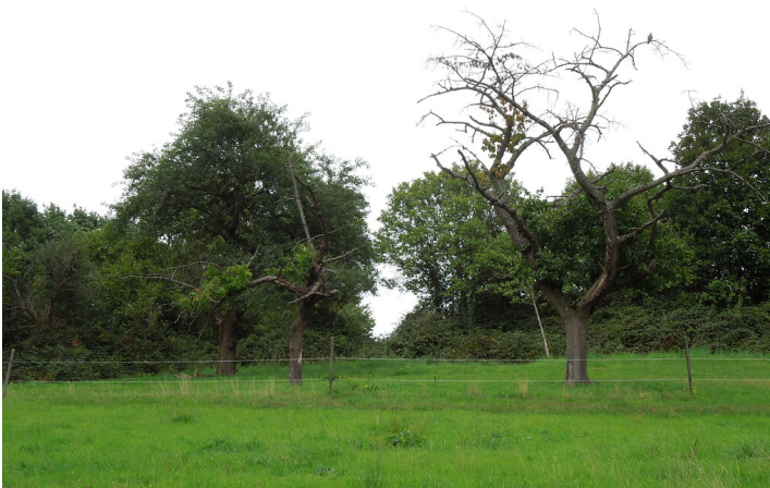
Blick auf die Streuobstwiese in Bonn-Lengsdorf (2017)