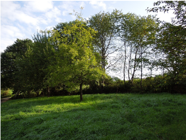
Blick auf die Streuobstwiese in Bonn-Röttgen (2017)