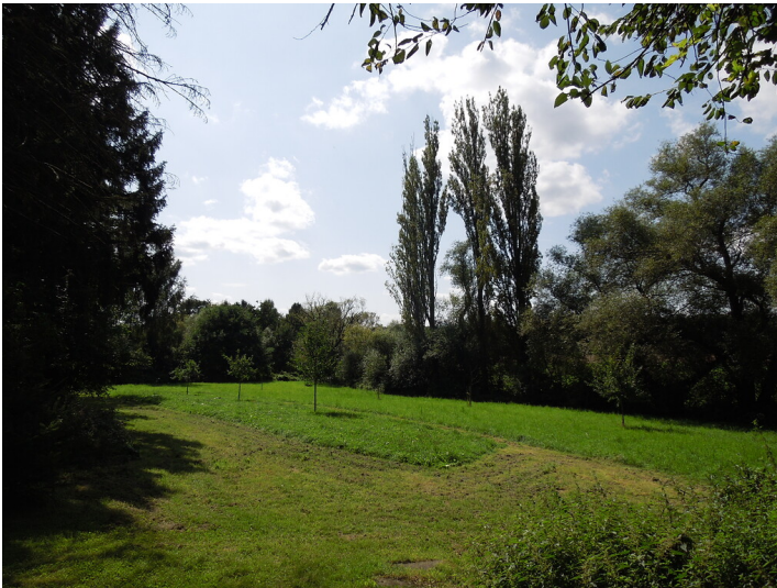
Blick auf die Streuobstwiese in Bonn-Röttgen (2017)