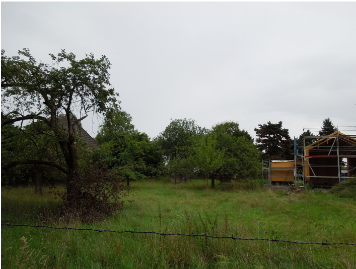
Blick auf die Streuobstwiese in Bonn- Friesdorf (2017)