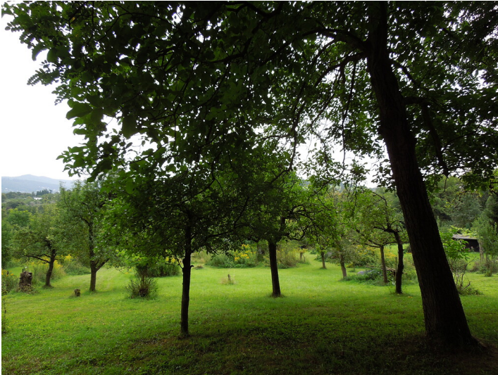
Blick auf die Streuobstwiese in Bonn- Mehlem (2017)