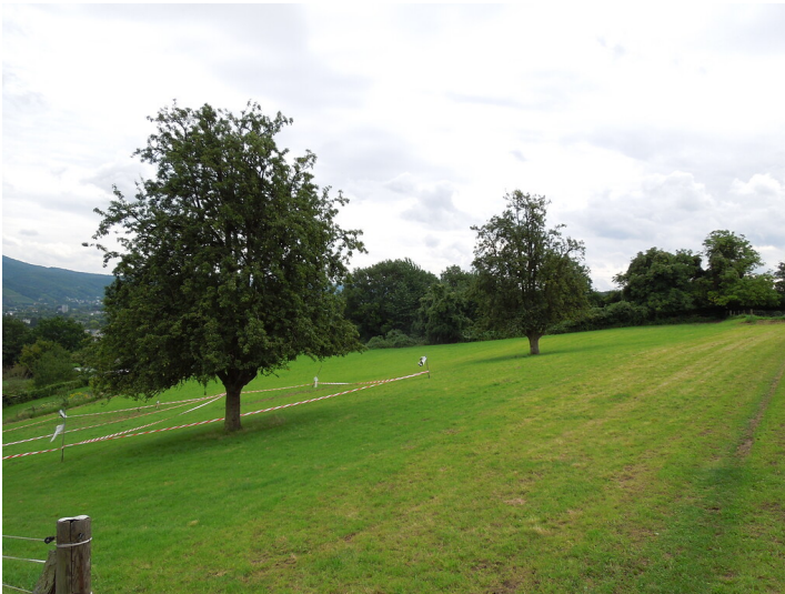
Blick auf die Streuobstwiese in Bonn- Lannesdorf (2017)