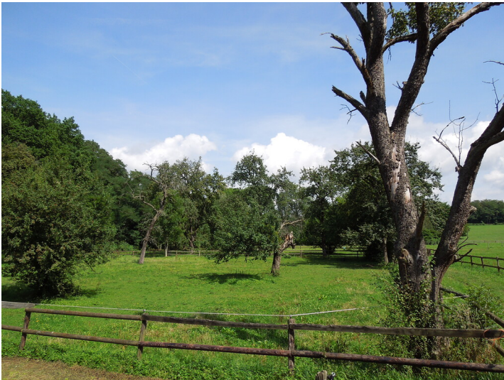
Blick auf die Streuobstwiese in Bonn- Mehlem (2017)