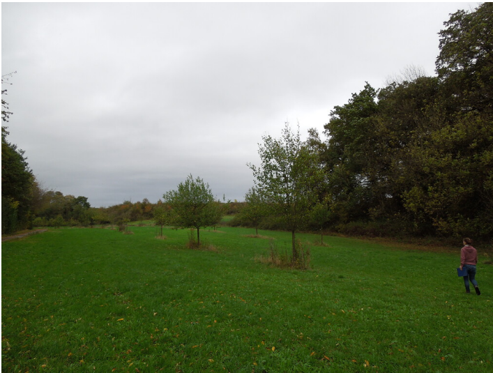
Blick auf die Streuobstwiese im Stadtteil Blatzheim (2017)