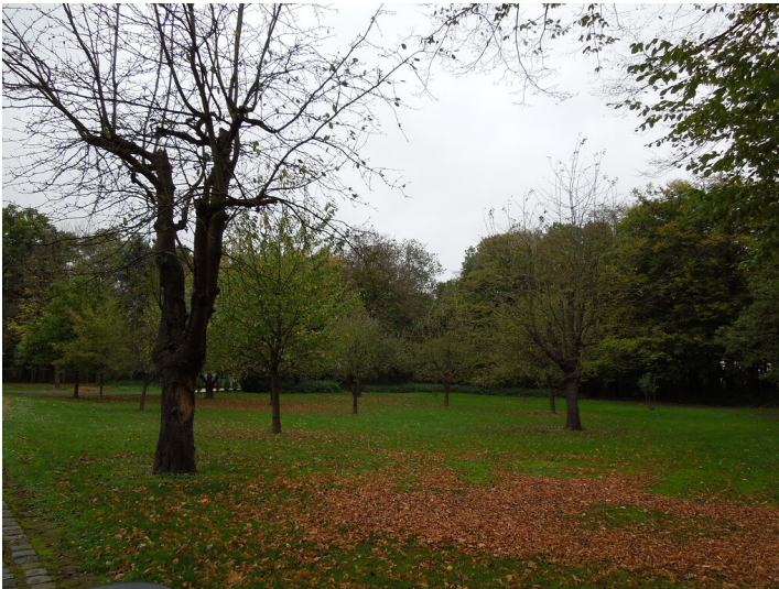
Blick auf die Streuobstwiese im Stadtteil Blatzheim (2017)