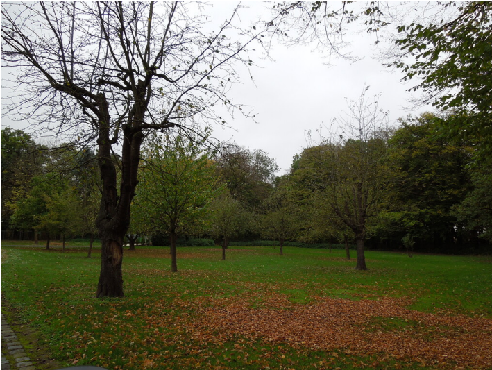
Blick auf die Streuobstwiese im Stadtteil Blatzheim (2017)