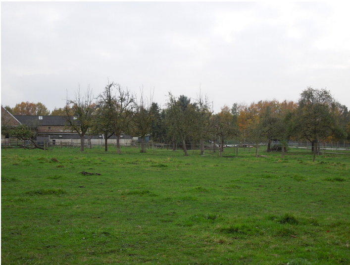
Blick auf Streuobstwiese im Stadtteil Gleuel (2017)