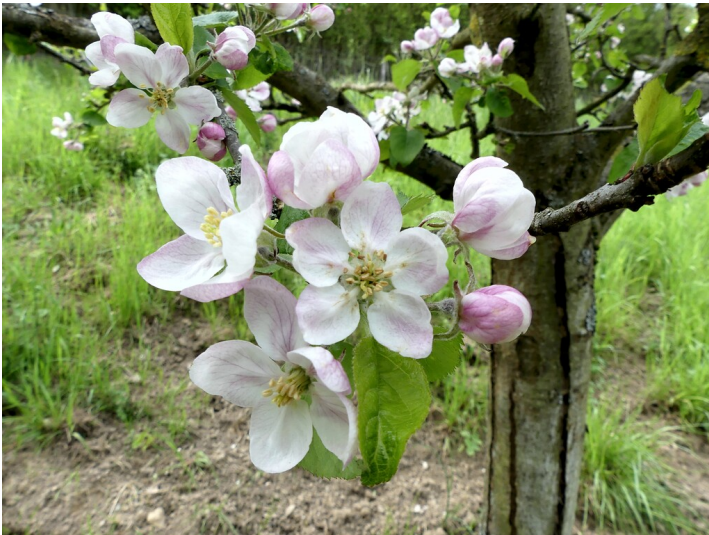
Apfelbaumblüten (2021)