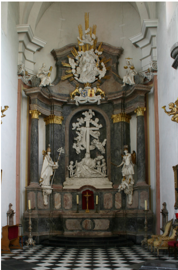
Hochaltar in St. Gregor im Elend zu Köln (2009)