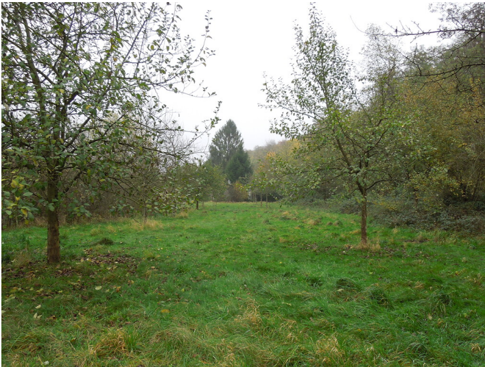
Blick auf die Streuobstwiese im Stadtteil Frechen (2017)