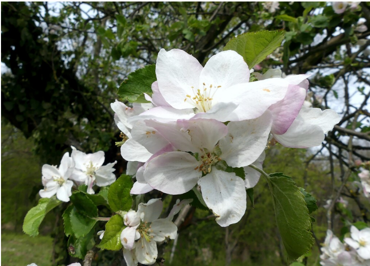
Apfelbaumbblüten (2021)