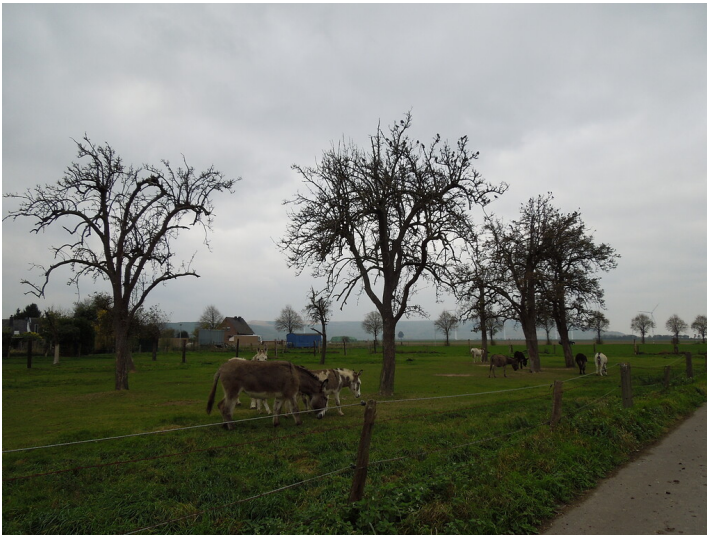
Blick auf die Streuobstwiese im Stadtteil Tollhausen (2017)