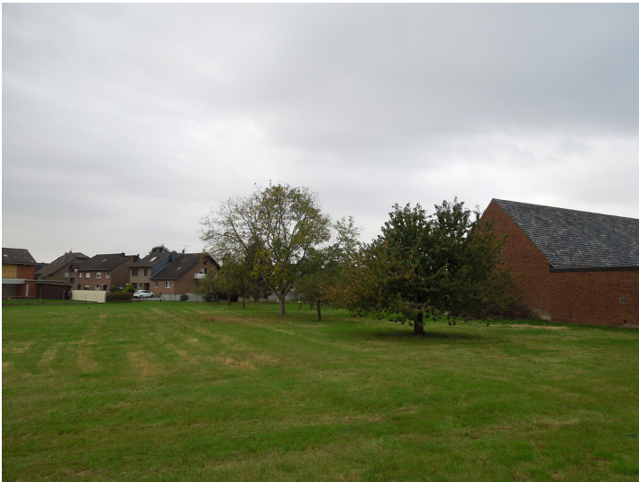
Blick auf die Streuobstwiese im Stadtteil Heppendorf (2017)