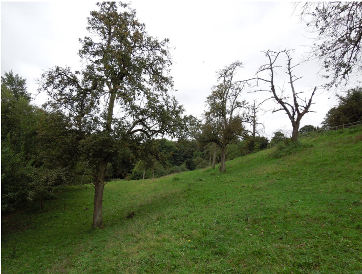
Blick auf die Streuobstwiese in Bonn-Lengsdorf (2017)