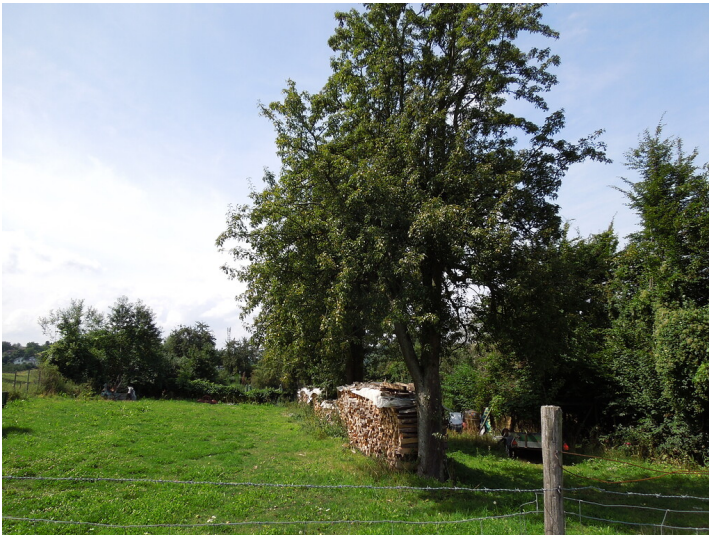
Blick auf die Streuobstwiese in Bonn- Lannesdorf (2017)