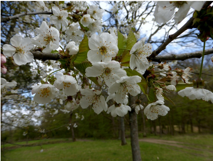
Kirschbaumblüten (2021)