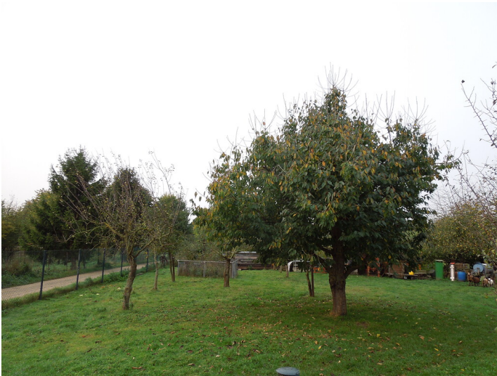
Blick auf die Streuobstwiese im Stadtteil Bliesheim (2017)