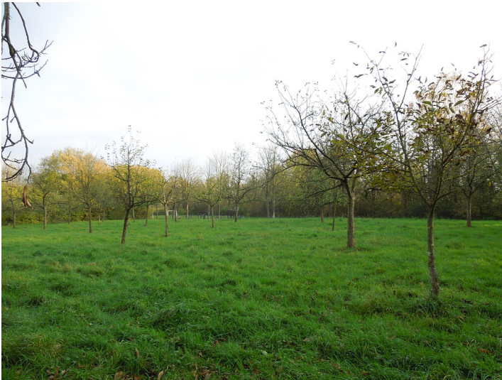
Blick auf die Streuobstwiese im Stadtteil Kaster (2017)