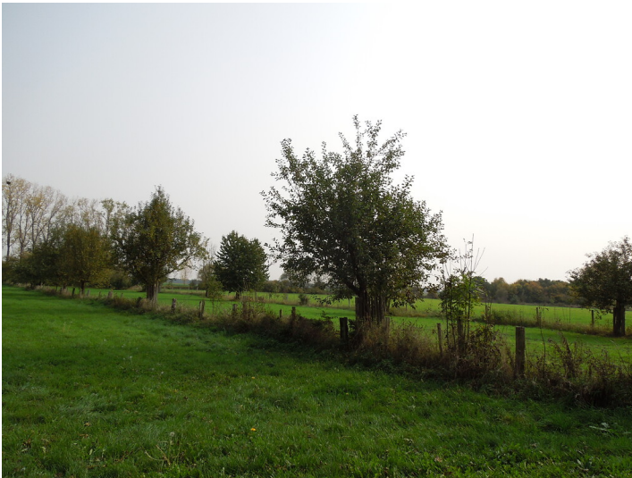
Blick auf die Streuobstwiese im Stadtteil Lechenich (2017)