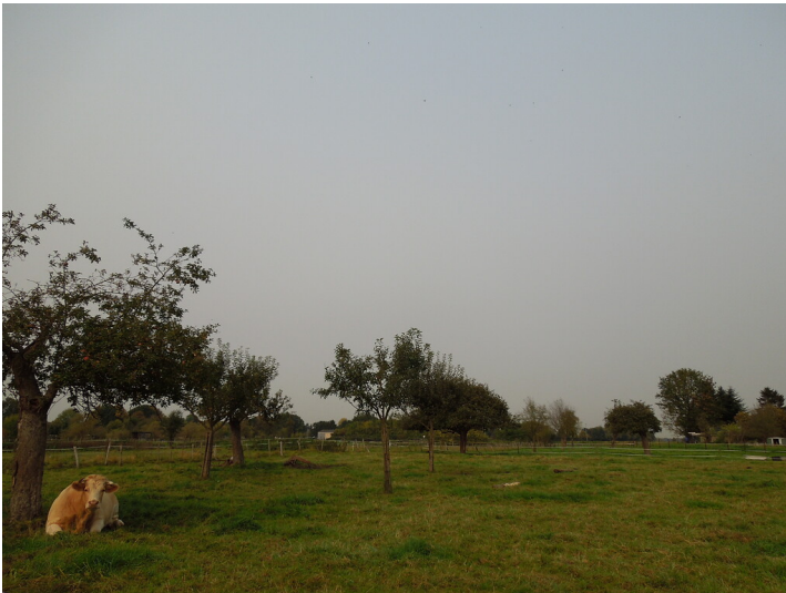
Blick auf die Streuobstwiese im Stadtteil Bliesheim (2017)