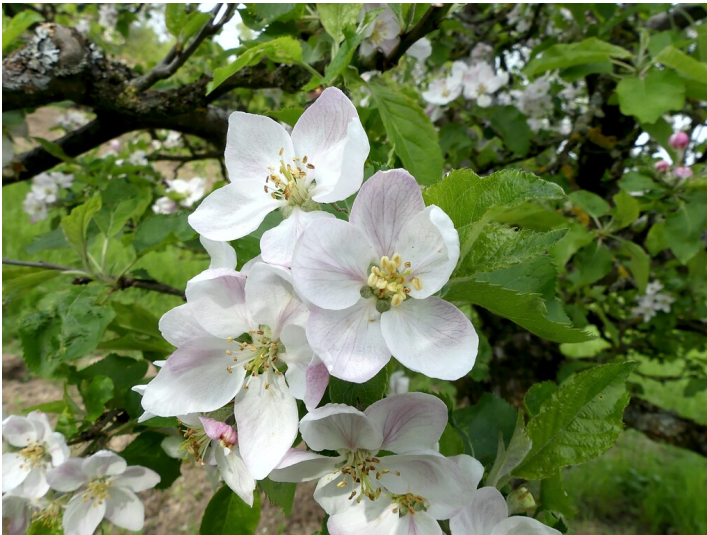
Apfelbaumblüten (2021)