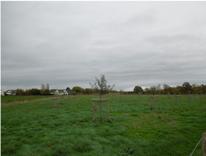
Blick auf die Streuobstwiese im Stadtteil Blatzheim (2017)