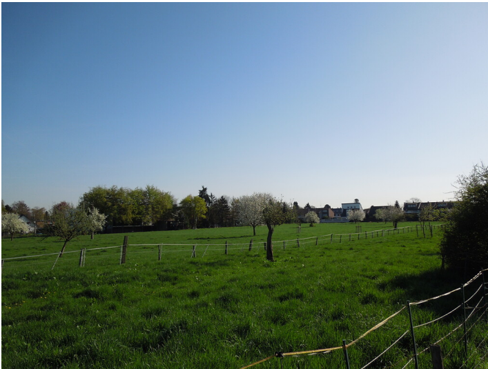
Blick auf die Streuobstwiese im Stadtteil Lechenich (2017)