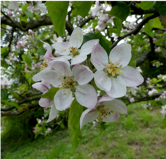
Apfelbaumblüten (2021)