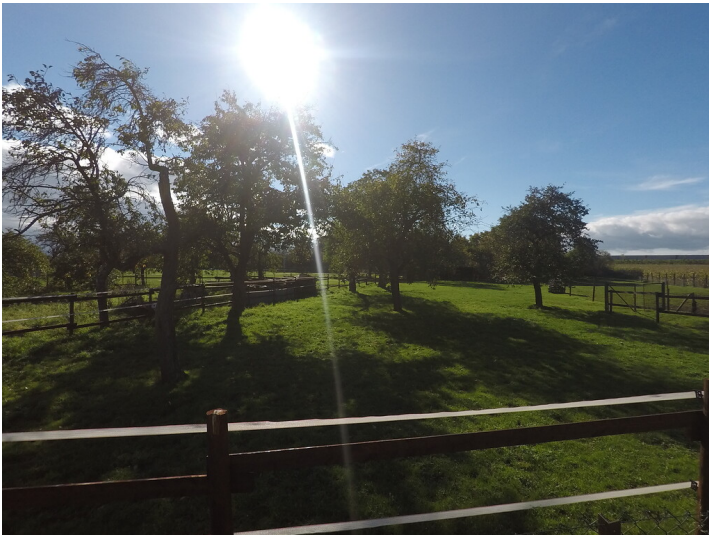
Blick auf die Streuobstwiese im Stadtteil Lechenich (2017)