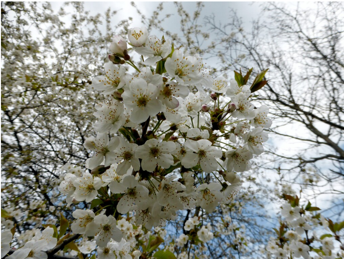
Kirschbaumb Blüten (2021)