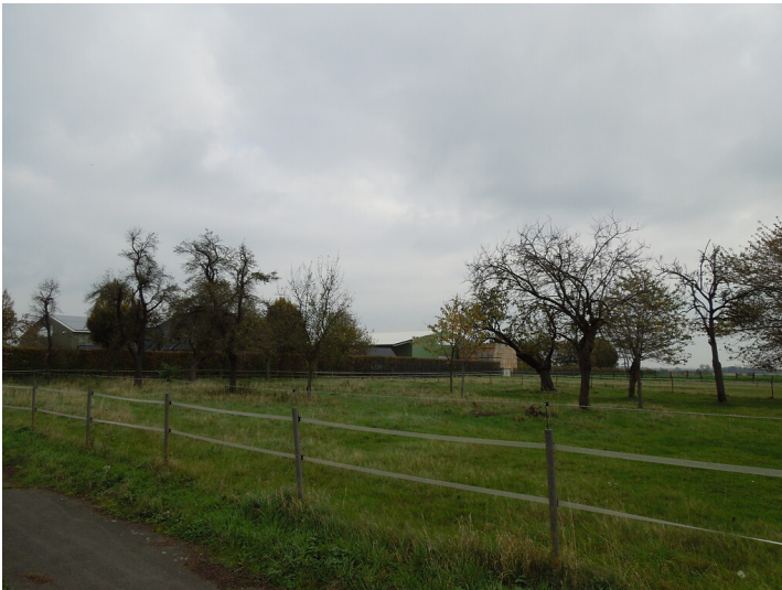
Blick auf die Streuobstwiese im Stadtteil Pütz (2017)