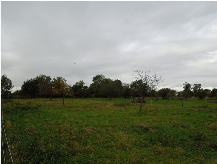
Blick auf die Streuobstwiese im Stadtteil Lechenich (2017)